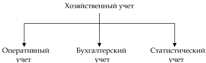
Рис. 1. Виды хозяйственного учета

Хозяйственный учет включает в себя три составляющих: оперативный учет, бухгалтерский учет, статистический учет (рис. 1).