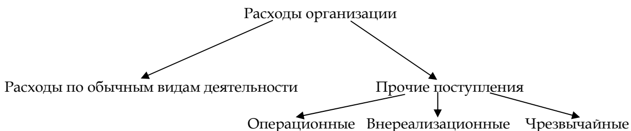
Рис.14.2 Классификация расходов организации

Расходы организации в зависимости от их характера, условия осуществления и направлений деятельности организации подразделяются на следующие виды (рис. 14.2).